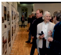
Wiedersehen: Besucher besichtigen die Ausstellung.

So wie Trüffelschweine einst nach unterirdischen Pilzen suchten, so forschte eine Projektgruppe der Architektenkammer Niedersachsen auch nach den versteckten architektonischen Perlen der 60er- und 70er-Jahre des vorherigen Jahrhunderts. Rund 700 Objekte kamen auf diese Weise 2007 auf eine Vorschlagsliste, genau 35 davon schafften es in die Wanderausstellung „Wiedersehen. Architektur in Niedersachsen zwischen Nierentisch und Postmoderne“, die 2010 und 2011 durch acht niedersächsische Städte tourte (das DAB berichtete). Die heute vielfach als Sanierungsfälle geltenden Bauten lösen mit ihrem ruppigen Charme nicht gerade Jubelschreie der Begeisterung aus – zumindest auf den ersten Blick. Zu gefallen war aber auch nicht Ziel der Ausstellung, vielmehr sollte das öffentliche Bewusstsein für Gebautes dieser Epoche geschärft und die unter starkem Veränderungsdruck stehenden Gebäude und Anlagen einer Neubetrachtung unterzogen werden. Niedersachsen war und ist damit Vorreiter einer wachsenden Bewegung, die um Wertschätzung der vorhandenen Qualitäten dieser Zeit bemüht ist, denn die Nachkriegsmoderne ist stärker denn je von Abriss und Verschwinden bedroht.