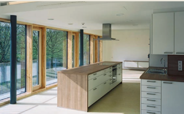
Pfützner Architekten